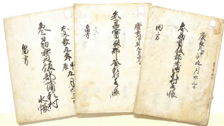
慶長九年参州宝飯郡蒲形村水帳写