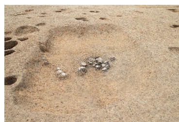
竪穴建物跡と かまど 竈跡（焼土）