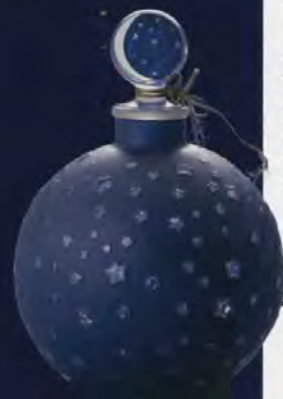
香水瓶(真夜中) ウォルト社 1924年以降