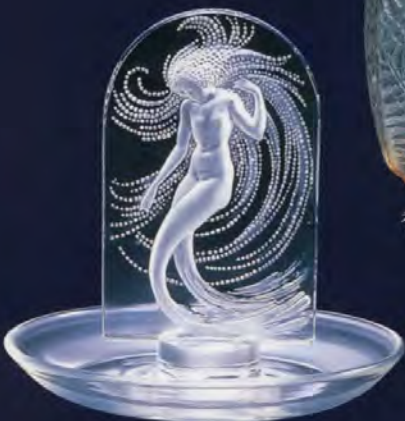
円形灰皿(ナイアド) 1930年