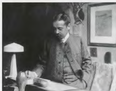
ルネ・ラリック René Lalique 1860~1945

20世紀初め、香水が一般の人々に広がるにつれ、香水メーカーは競って美しいデザインの香水瓶を求めようになりました。宝飾作家として活躍していたフランスのルネ・ラリック(1860~1945)は、香水商フランソワ・コティ(1874~1934)のためにガラス製の香水瓶を制作します。それらの香水瓶は繊細で優美なデザインにより、瞬間に人気を集めました。ラリックは以降、ガラス工芸家となり、20世紀初頭のモダンな様式「アール・デコ」の生みの親となったのです。