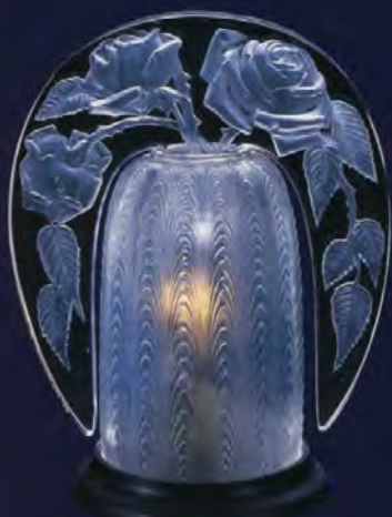
電気式常夜灯 パビュム・ランプ(バラ) 1921年