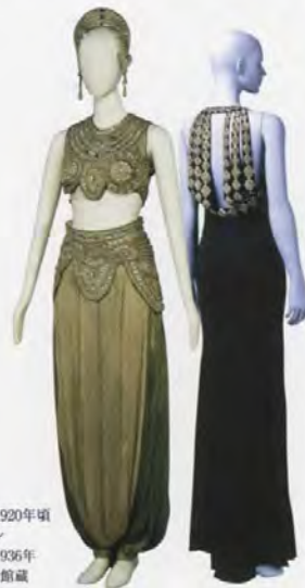
左 ポール・ボワレ (イヴニングドレス) 1920年頃 右 ジャンヌ・ラングヴァン (イヴニングドレス) 1936年 神戸ファッション美術館蔵

本展では、ガラス工芸コレクションで世界屈指の質、量を誇る北澤美術館の所蔵品から、ラリックが手掛けた香水瓶を中心に、アクセサリーやパビュム・ランプ、化粧品容器などを紹介します。あわせて神戸ファッション美術館の協力により、アール・デコの装いを代表するドレスやファッション・プレート(ファッション誌を飾った手彩色の版画)を展示します。