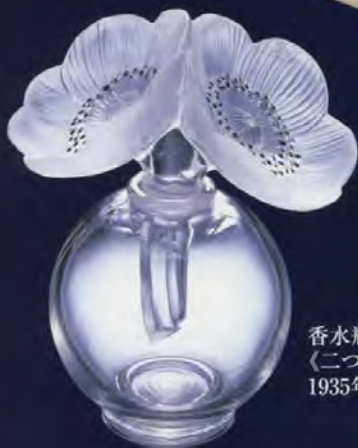
香水瓶 《二つのアネモネと花瓶》 1935年