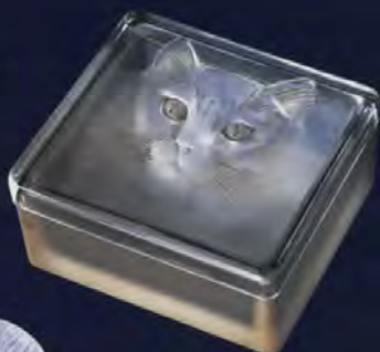
シガレットケース(ねこ) 1932年