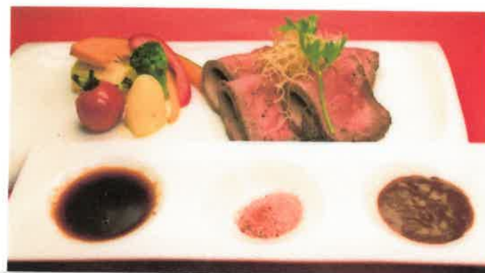
ローストビーフランチ(ライス Or パン付)