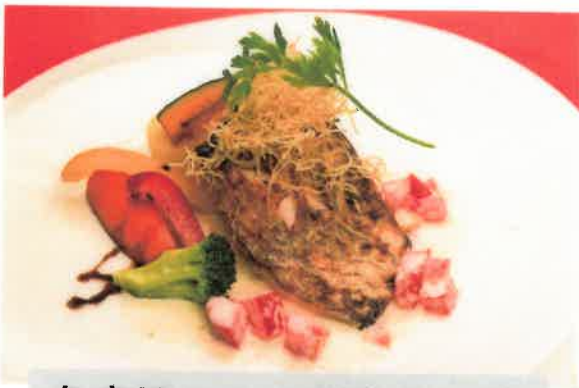
魚市場からの鮮魚ランチ (ライス Or パン付)