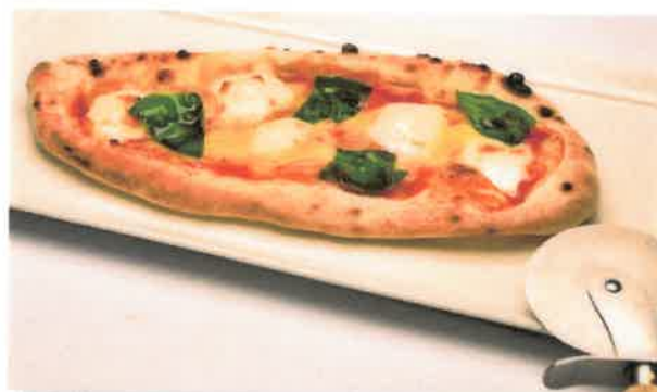
ピッツァランチ(ハーフサイズ)