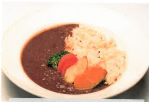
十五穀米キーマカレー