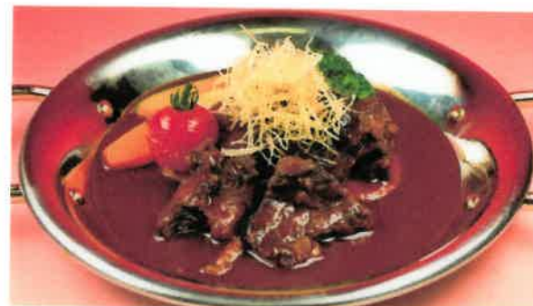
ビーフシチューランチ (ライス Or パン付)