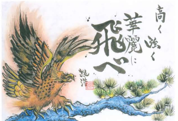
TAKAHIRO (EXILE) 「飛躍」