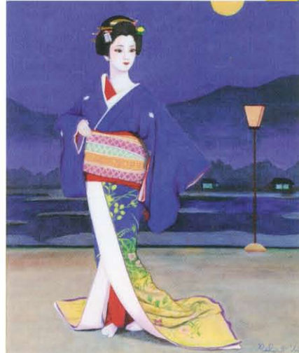
ラトナ・サリ・デヴィ・スカルノ「祇園の月」