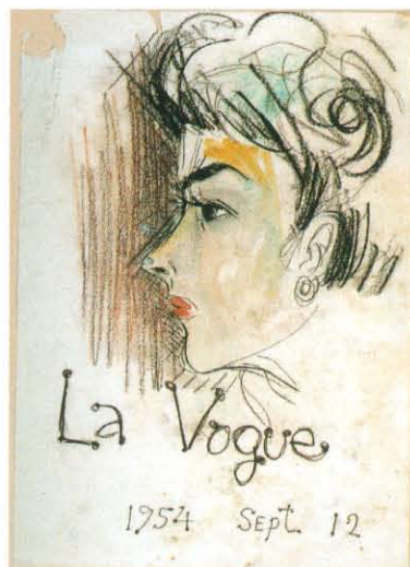
石原裕次郎「La Vogue 1954 sept 12」